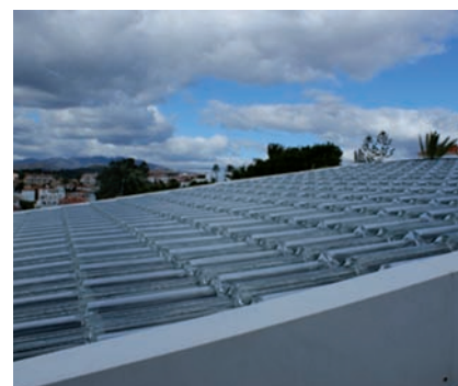
Tejas solares transparentes en Mijas.

La idea no es nueva. Scott Brusaw puso en 2010 utilizar la infraestructura de las autopistas estadounidenses para abastecer la demanda energética del país. Su