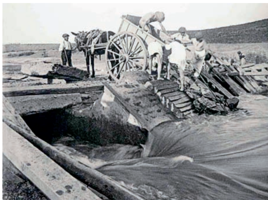
Figura 5. Fotografía de las obras. El material se transportaba con los medios de la época, principalmente, carros arrastrados por mulas

La planta hidroeléctrica de San Román de los Infantes, obra de Federico Cantero Villamil, es el primer aprovechamiento del Duero para suministrar energía eléctrica por medio de corriente alterna. Su construcción se inició en 1899, solo seis años después de que Tesla exhibiera las ventajas de la corriente alterna en la Expo-