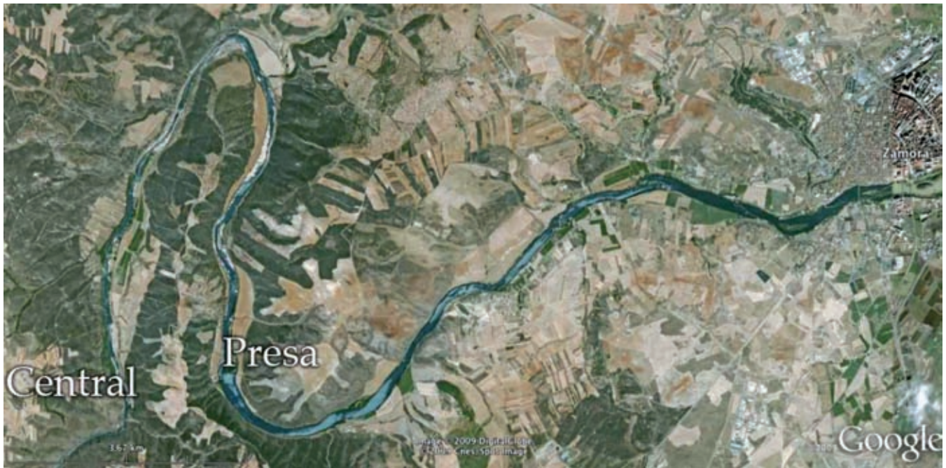
Figura 1. Planta hidroeléctrica de San Román de los Infantes. Un túnel horada la loma rodeada por el meandro del Duero para conducir el agua desde la presa a la central

demasiado largas en direcciones radiales. La máquina de vapor era entonces el único motor realmente útil para mover los generadores eléctricos, pues podía situarse donde conviniera.