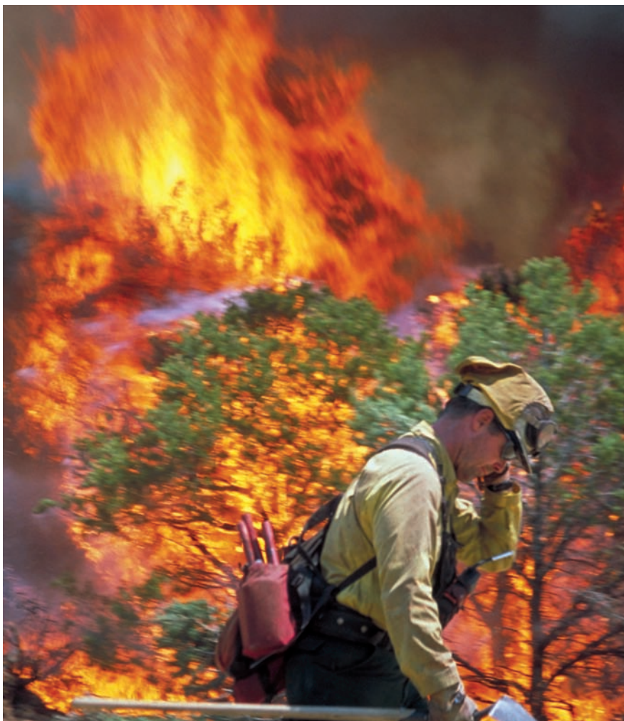
Un bombero camina junto a un incendio forestal mientras las llamas se aproximan.

parte de la estrategia global del Gobierno para luchar contra el cambio climático, más aún si tenemos en cuenta que los científicos ya han advertido que el próximo cuarto de siglo habrá temperaturas más elevadas, menos precipitaciones y que se registrará una mayor velocidad del viento en verano. Así, WWF refleja en su estudio que si en 2050 el aumento de la temperatura global supera los 2 °C, en España habrá entre dos y cuatro semanas más al año de riesgo extremo de incendios forestales.