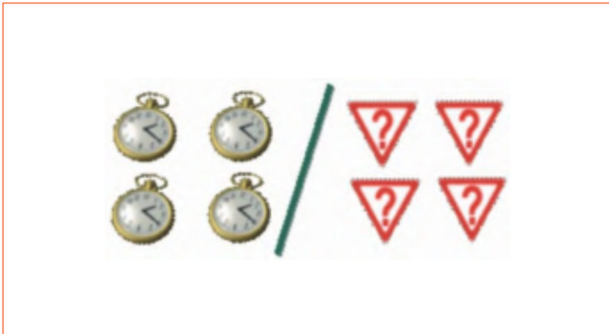
Figura 2. Regla de los cuatro minutos y las cuatro preguntas.

No se trata de convertirnos todos en showmen profesionales; la regla de oro en cuanto a dirigirse al público es la naturalidad. Lo que sí es imprescindible es eliminar todos los errores que puedan hacer que el auditorio se vuelva en nuestra contra, y maximizar todas nuestras cualidades que puedan ponerlo a nuestro favor. Un buen comienzo es una agradable sonrisa. Se trata de uno de los ras-