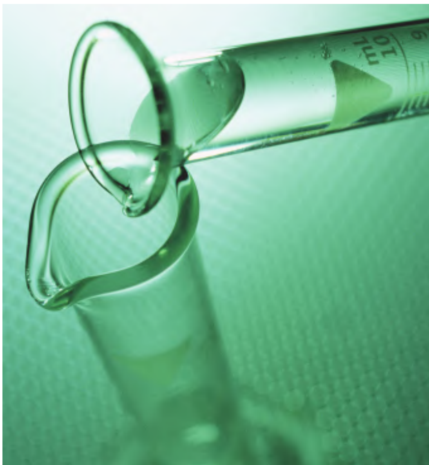
La llamada «química verde» busca sustancias y procesos más seguros para la salud y el medio.

de datos de seguridad a su cliente cuando le suministre una sustancia o un preparado peligroso. Sin embargo, REACH también establece la obligación de entregar una ficha de datos de seguridad cuando se suministren sustancias que sean PBT (persistentes, bioacumulables y tóxicas), MPMB (muy persistentes, muy bioacumulables), o preparados que contengan tales sustancias. Estas fichas de seguridad deben estar en la lengua oficial del país en el que se esté comercializando la sustancia o el preparado en cuestión.