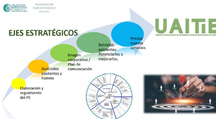
Ejes Plan Estratégico UAITIE.