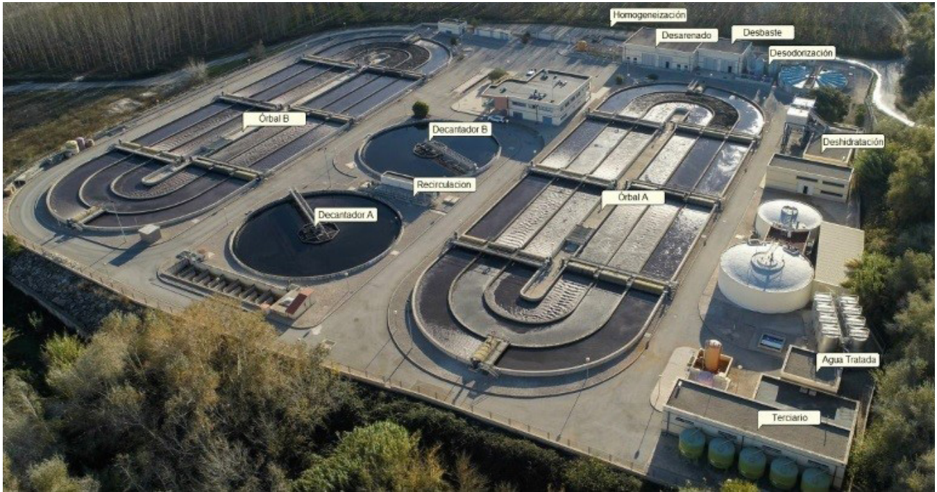
La inclusión de sistemas en la nube, en las estaciones depuradoras de aguas residuales (EDAR), beneficiará el control del proceso y mejorará la calidad del agua. (Crédito: https://transact-ecsel.eu ).

(AEDyR) afirma que estos elementos son claves en el Plan Hidrológico Nacional español como soluciones para reducir los déficits hídricos históricos, optimizar el uso del agua y fortalecer la seguridad hídrica a largo plazo. La desalación permitiría aprovechar fuentes alternativas de agua, mientras que aportaría recursos hídricos adicionales. Recursos hídricos que podrían ser aprovechados por la industria o la agricultura.