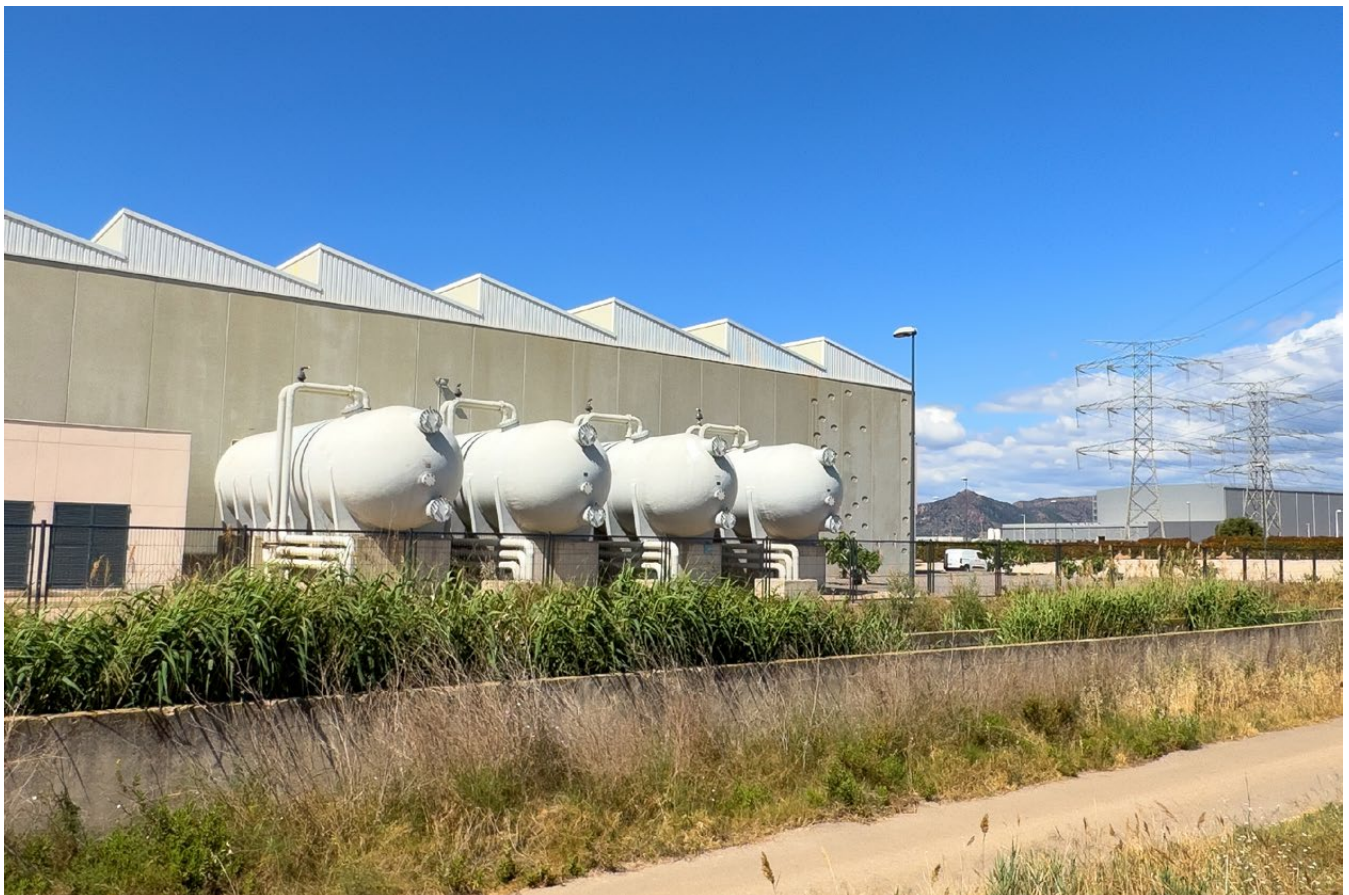
Planta desalinizadora de agua marina, ubicada en el Polígono Industrial del Puerto de Sagunto (Valencia).

El agua es un recurso esencial para la vida, la salud, la producción de alimentos y la generación de energía. Sin embargo, su disponibilidad y calidad se ven amenazadas por factores como el crecimiento demográfico, el desarrollo económico, la contaminación y el cambio climático. Según la ONU, más de 2.000 millones de personas viven en países con estrés hídrico y se prevé que para 2050 esta cifra aumente a 5.700 millones.