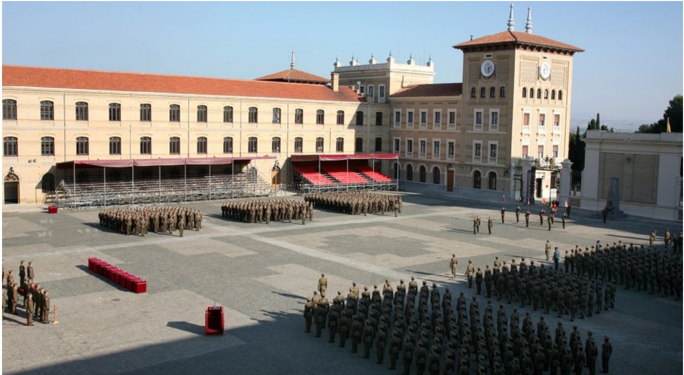
Acto en el patio de armas de la Academia General Militar.

La Academia General Militar, ubicada en Zaragoza, celebraba el pasado mes de febrero la ceremonia en conmemoración del CXXI Aniversario de la creación de este centro docente militar, fundado en 1882. Desde entonces, en la AGM, y a través de sus tres épocas de actividad, se ha formado a más de 29.000 oficiales del Ejército de Tierra, Guardia Civil y Cuerpos Comunes de las Fuerzas Armadas