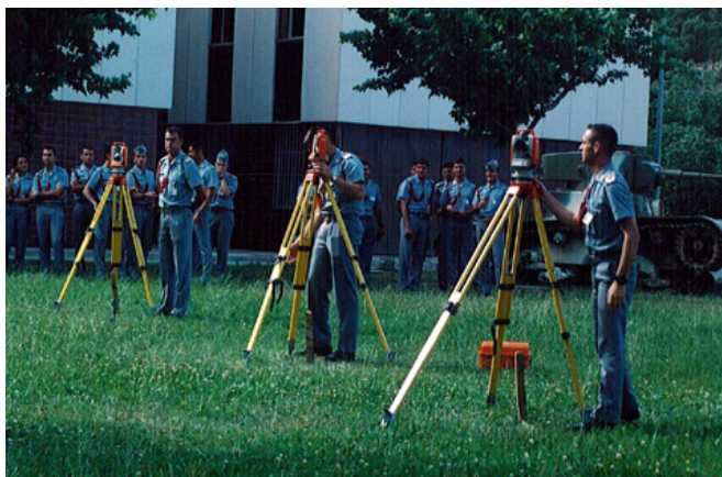
Clase práctica de topografía en el CUD-AGM.

Además, en el centro se podrán cursar estudios de posgrado y desarrollar líneas de investigación consideradas de interés en el ámbito de las Fuerzas Armadas y de la paz, la seguridad y la defensa. También se establece que el CUD impulsará el desarrollo de la docencia y contribuirá a potenciar la investigación científica de las materias recogidas en sus planes de estudios.