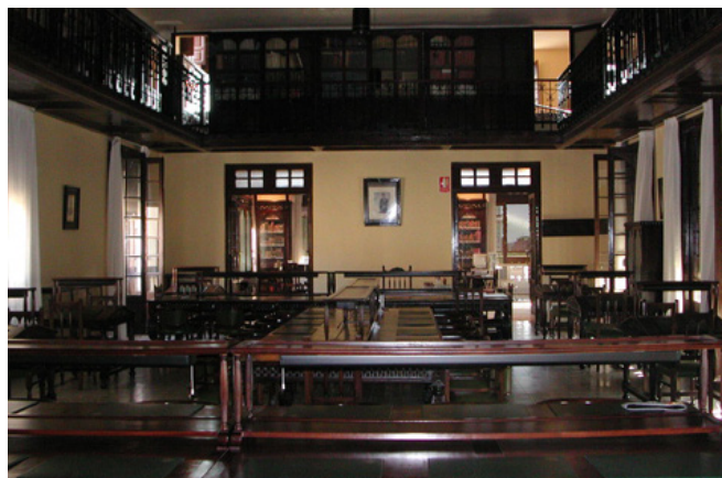
Biblioteca histórica de la AGM.