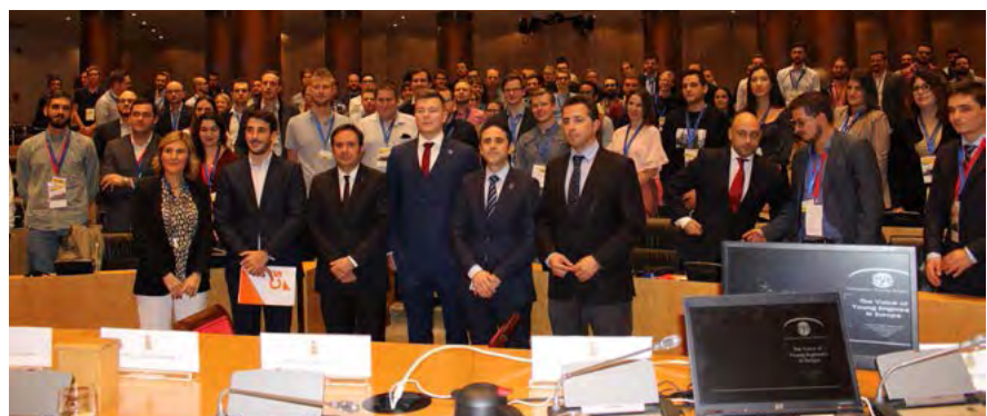
Acto con los grupos parlamentarios, en el Congreso de los Diputados.

Al acto de inauguración asistieron los 150 ingenieros que durante cuatro días participaron en las actividades programadas: talleres ( workshops ), celebrados en el Colegio Oficial de Graduados e Ingenieros Técnicos Industriales de Madrid, y visitas a empresas, como Airbus, Renfe, Canal de Isabel II, Naturgy, Amazon, Ins-ter, o a instituciones (Congreso de los Diputados y Ayuntamiento de Madrid); además del Council Meeting (Consejo de EYE), que tuvo lugar el sábado 19 de octubre en la sede del COGITI.