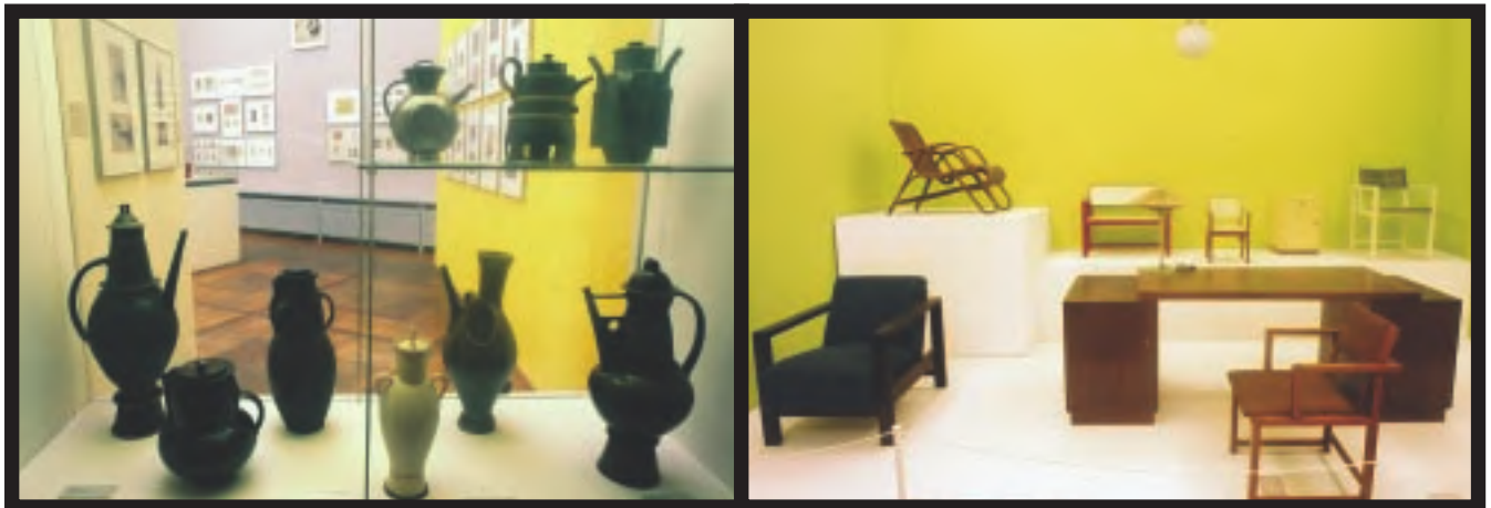
A la izquierda, cerámica de Theodor Bogler (1923) y Otto Lindig (1922). A la derecha, mobiliario de Erich Dieckman (1926). Ambas imágenes corresponden al Museo de la Bauhaus en Weimar (Alemania).

Su inicio en la Bauhaus estuvo marcado por un ambiente revuelto (se llegó a convocar una huelga por parte de los estudiantes que reivindicaban seguir con los principios establecidos por Meyer). Mies solucionó el problema de una manera autoritaria: eliminó los estatutos de la escuela para definir unos nuevos y expulsó a los estudiantes más cercanos a Meyer.