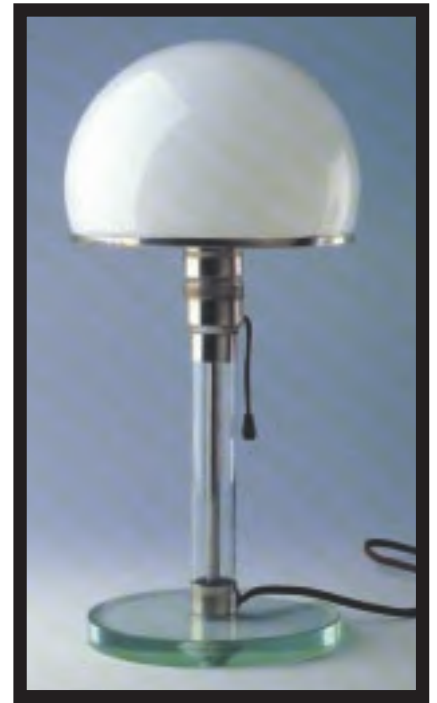
Lámpara de mesa, Wilhelm Wagenfeld. 1923-1924. Se observa en este diseño los principios fundamentales de la Bauhaus: vidrio y cristal con formas básicas como el círculo y el cilindro, en líneas rectas y sencillas. Su diseño moderno y revolucionario hicieron que aún en 1982 obtuviera el premio Buena Forma en Alemania. Esta lámpara constituye uno de los primeros objetos de diseño industrial.

Con la llegada a Dessau, Gropius se planteó reorganizar la estructura de la escuela. En las reformas que realizó tuvo en cuenta la producción: todos los talleres tendrían una sección formativa y otra productiva. Al frente de algunos talleres puso a alumnos que habían terminado