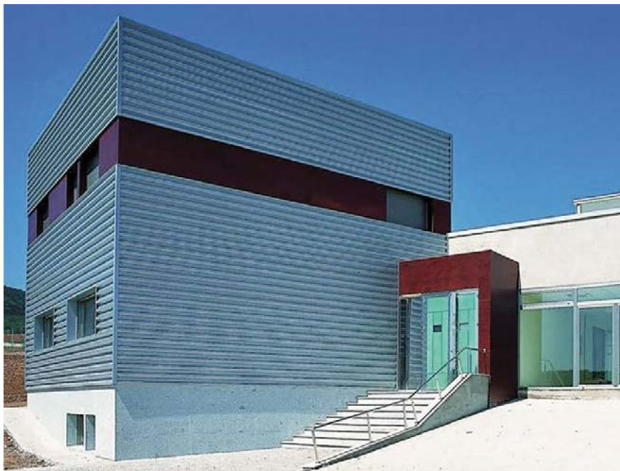
Sede de JMP Ingenieros en Sotés (La Rioja).

Especial incidencia tiene la división de Factory 4.0, en la que JMP recibió en 2016 el 2º premio Satellite 4.0 por