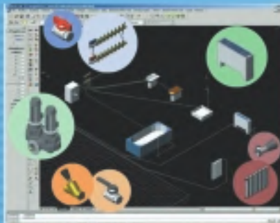
Cálculo y diseño de calefacción e hidro-sanitarias