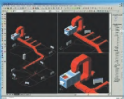
Cálculo y diseño de Conductos de Aire