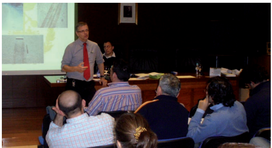
Curso de experto en peritación judicial realizado en Coeticor el pasado mes de enero.

También cabe destacar que dedica un espacio importante a las certificaciones energéticas de edificios, cuya normativa entró en vigor el pasado 1 de junio, para todos aquellos propietarios que compren, vendan o alquilen viviendas e inmuebles, por lo que es obligatoria la certificación energética de los mismos. Y, finalmente, queremos dejar constancia de la información ofrecida a sus colegiados con relación a la previsión social sobre empleo, legislación, publicaciones, etcétera.