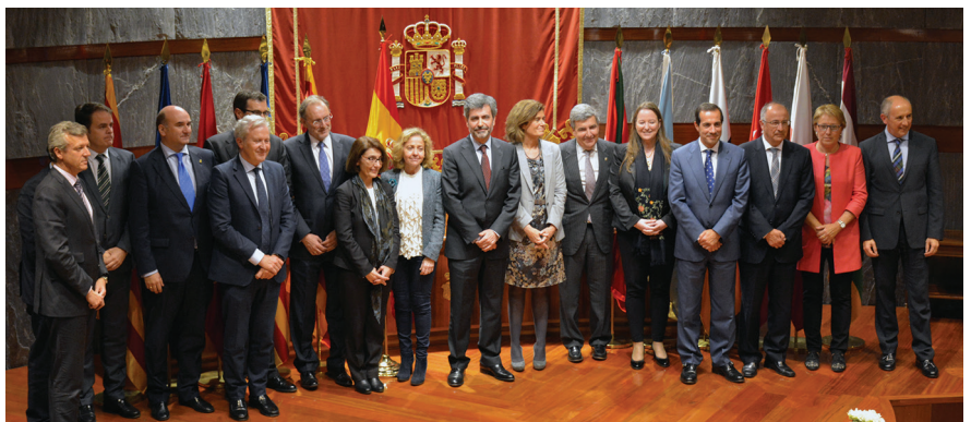
Carlos Lesmes (en el centro) con los representantes del Ministerio de Justicia y de las Comunidades Autónomas.

La In.Me.In. cuenta, además, con un portal de internet ( www.inmein.es ), que pone a disposición de la sociedad y de las Administraciones estatal, autonómicas y locales, una herramienta de búsqueda de ingenieros mediadores, distribuidos en 50 delegaciones territoriales, inscritos en el Registro de Ingenieros Mediadores (RIM). La institución cuenta con cerca de 400